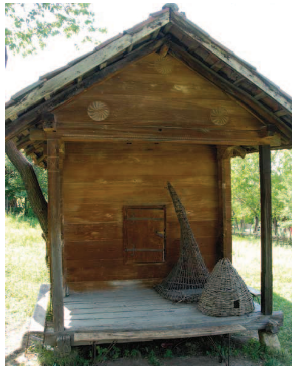
Bildet viser en georgisk bygning for oppbevaring av korn. Over inngangsdøren ser man tre symboler med solhjulet skåret inn i veggene.

KARVESKURD OG AKANTUS I NORGE Karveskurd er den norske betegnelsen på treskurd med geometriske motiver.