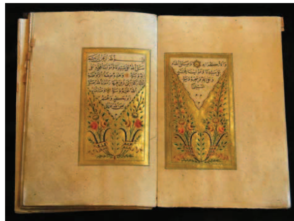
Kursiv kalligrafi ble vanlig etter 1000-tallet. Legg også merke til blomsterdekor som kan tolkes som uttrykk for paradiset. Damaskus var sentral i pilegrimsferden til Mekka. Pasha Al-Azm i Syria var ansvarlig for reise og sikkerhet for alle reisende mellom Istanbul til Mekka.

Islam er en monoteistisk religion, som vil si at man tilber kun én gud på lik linje med jødedommen og kristendommen.