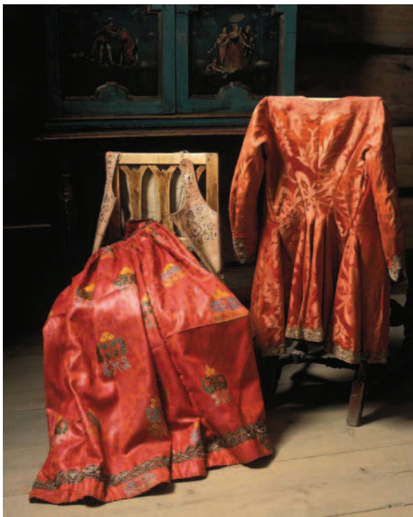
Brudedrakt fra Vågå datert 1749 lagd av atlasvevd ulltey. Atlask, damask og brokade var mye brukt i Norge, men var kostbart og måtte importeres fra utlandet. Opprinnelsesland er ofte ukjent.

Adelens, de geistliges og borgerskapets interesse for islamsk kunst var et uttrykk for luksus og makt. Kardinal Wolsey i England bestilte arabiske tepper fra Venezia i 1518 og i 1520. Teppene omtales som Damaskus-tepper. I portretter malt av Hans Holbein (1497–1543) og andre renessansemalere på 1500-tallet ser man tepper brukt som veggdekor, draperi over møbler eller som gulvteppe. Tepper har blitt typeklassifisert etter hvilke renessansemalere som har malt dem. For eksempel finnes fire typer Holbein-tepper, og tepper av Giovanni Bellini (1430–1516), Carlo Crivelli (1435–