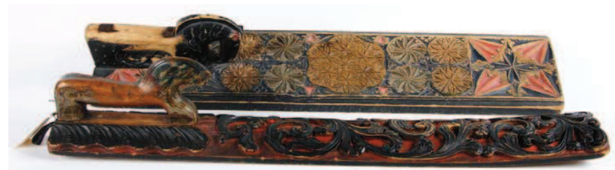
To mangletre fra Maihaugens gjenstandssamling som viser karveskurd med geometriske symboler med seksbladroser og solhjul. Det fremste har dekor med akantus som ble et meget populært motiv i Gudbrandsdalen på 1700- og 1800-tallet.