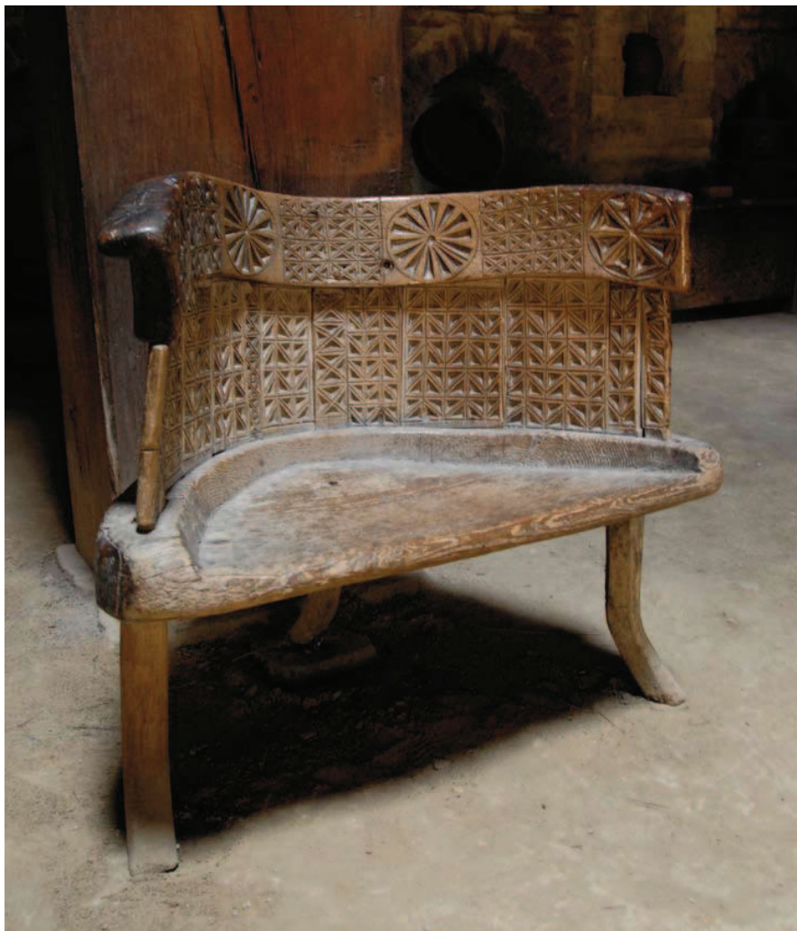
Maihaugen er samarbeidsmuseum med friluftsmuseet Georgia Chitaia i Tbilisi, Georgia. Innen treskurd i Georgia ser man flere fellestrekk ved mønstre og symbolbruk. Dette er en stol brukt av husbonden og var plassert sentralt i huset ved et åpent ildsted.