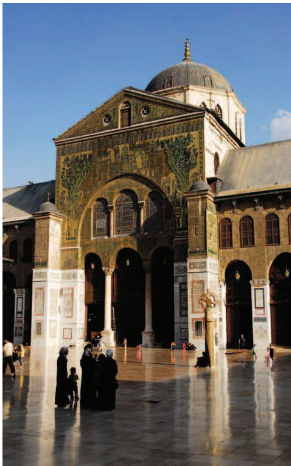
Umayyadmoskéen i Damaskus bygd mellom 706–715 e.Kr. viser typisk bysantinsk stil med kuppel, korintiske søyler og glassmosaikk. Tidligere lå et romersk tempel her og senere en kirke. Johannes døperen ligger begravet i moskéen, et helligt sted også for muslimske pilegrimer. Glassmosaikk ble mye brukt i islamsk kunst under Umayyadene, men en østlig påvirkning med glaserte keramiske fliser overtok etter hvert som fasadedekor på moskéer.

Til bygging og dekorering av moskéen i Damaskus ble over 200 håndverkere lånt fra den bysantinske keiseren. Kuppelen, de korintiske søylene og mosaikken vitner om romersk bysantinsk stilpåvirkning. Bruk av bysantinske håndverkere kan ha flere årsaker. For det første var bysantinsk arkitektur noe av det mest utviklete og eksklusive for sin tid. For det andre ville en videreføring av arkitektur og dekor fungere som en slags legitimering av det nye regime. Altså en legitimering av makt. Umayyadene i Syria regjerte over store territorier med innbyggere som ennå ikke var muslimske. Kontinuitet i arkitektur og kunst kan ha virket avdramatiserende og sikret ro og aksept i befolkningen.