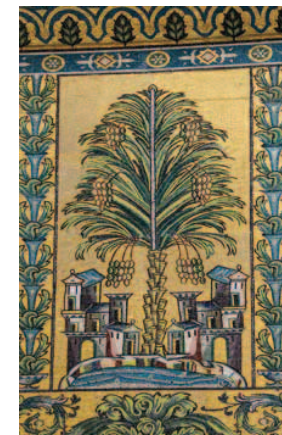
Detalj av motiv av hage og paradiset på Umayyademoskéen lagd av glassmosaikk. Motivet er symmetrisk oppbygd med et tre i midten, kanskje uttrykk for Livets tre. Motivet er omkranset av planteranker og akantus som også viser videreføring av bysantinsk stil.

Den eldste skriftformen er kufisk skrift som ble oppfunnet på 600-tallet i byen Kufa i Irak og ble den dominerende religiøse skriftform fram til 1100-tallet. Skriften kjennetegnes på sine lange vertikale og rette linjer. Det fantes et mangfold av språk innenfor kalifatet som arabisk, persisk og tyrkisk. Arabiske skifttegn ble brukt både til persisk og tyrkisk språk, men her valgte man egne skrifttyper tilpasset