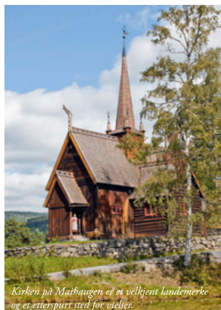
Kirken på Maihaugen er et velkjent landemerke og et etterspurt sted for vielses.