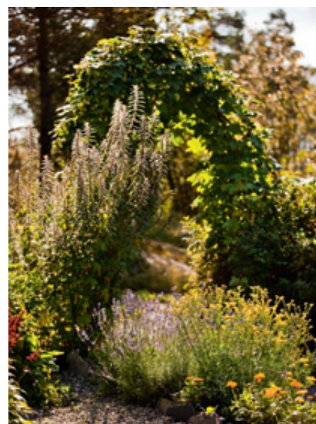
Museets urtehage gir god tilgang på spennende smakstilsetninger.

På spørsmålet om hva han tror er årsaken